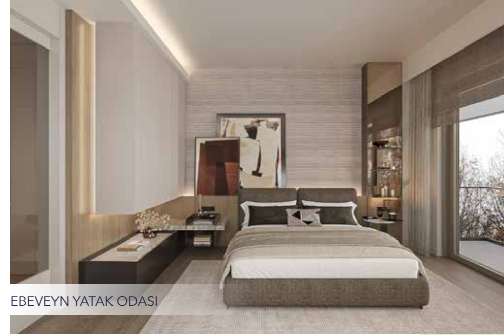
EBEVEYN YATAK ODASI