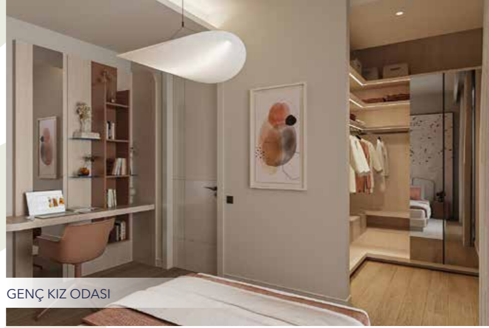
GENÇ KIZ ODASI