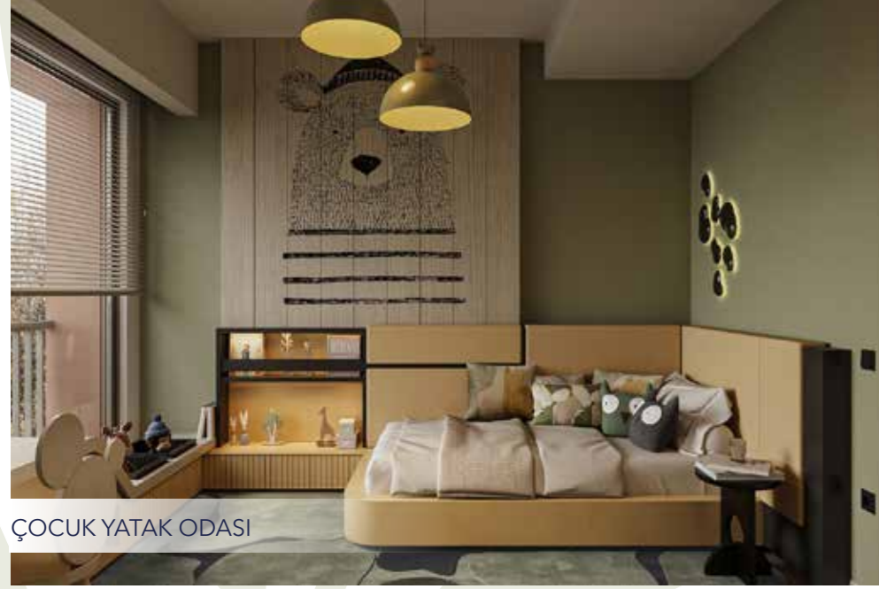
ÇOCUK YATAK ODASI